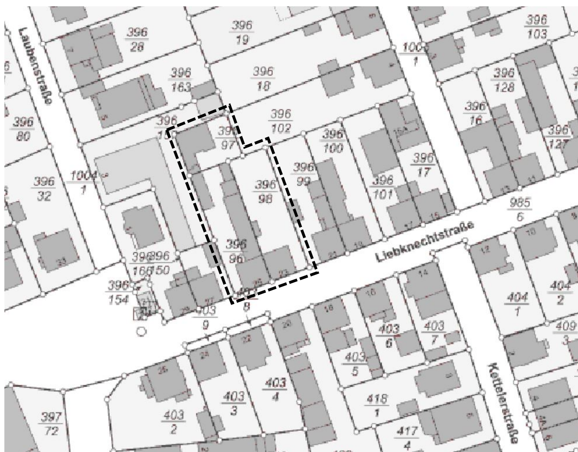
Abbildung: Abgrenzung des Geltungsbereichs und Umgebung (nicht maßstäblich)