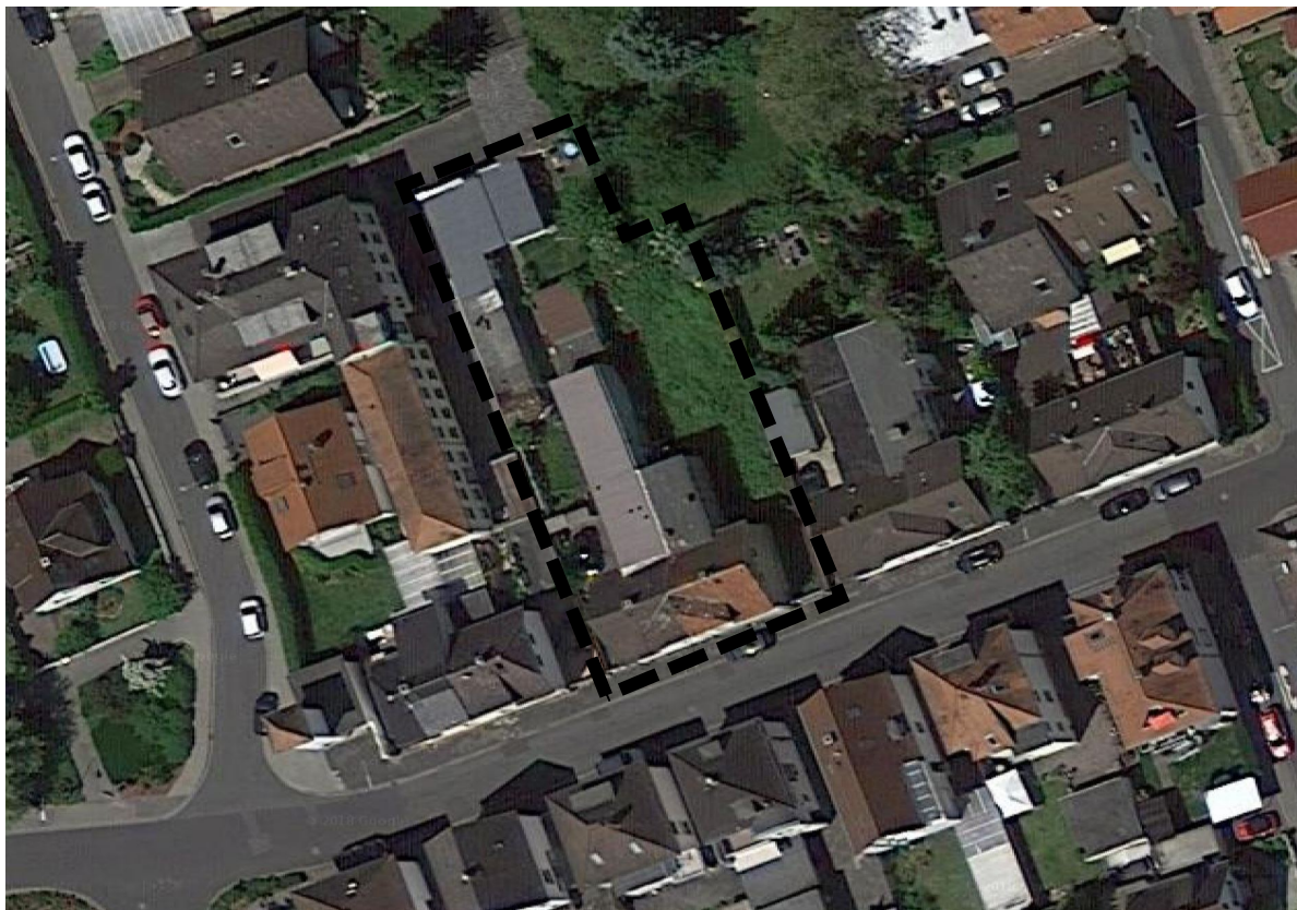
Abbildung: Luftbild des Plangebiets mit Geltungsbereich B-Plan