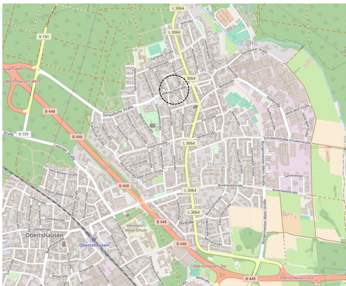
Abbildung: Lage des Plangebiets

Die Stadt Obertshausen im Landkreis Offenbach ist Mittelzentrum im Verdichtungsraum und hat die Funktion eines Wohn- und Gewerbestandortes. Das rund 969 m 2 große Plangebiet liegt an der Liebknechtstraße, einer Querstraße zur Seligenstädter Straße (L 3064), im nördlichen Stadtteil von Hausen.